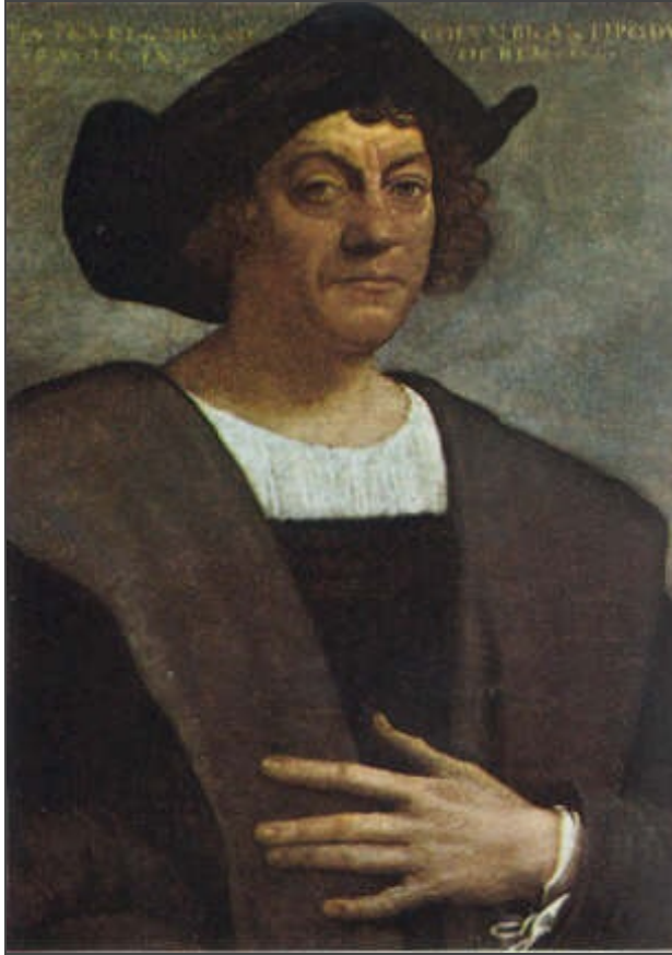
Retrato de Cristóbal Colón. Sebastiano del Piombo (Sebastiano Luciani, ca. 1485-1547)